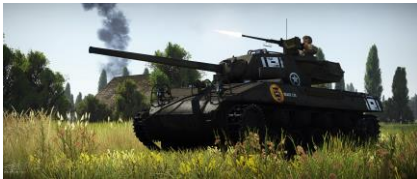
Le M18 'Black Cat' avec un canon de 76 mm M1A2

res la campagne de Tunisie il devint évident que le canon M3 de 75mm était dépassé face aux nouveaux chars Allemands qui faisaient leur apparition. Tous les projets utilisant ce canon furent donc immédiatement abandonnés, y compris le prototype du T67. La priorité fut donnée aux prototype du T70, équipé du tout nouveau canon de 76mm.