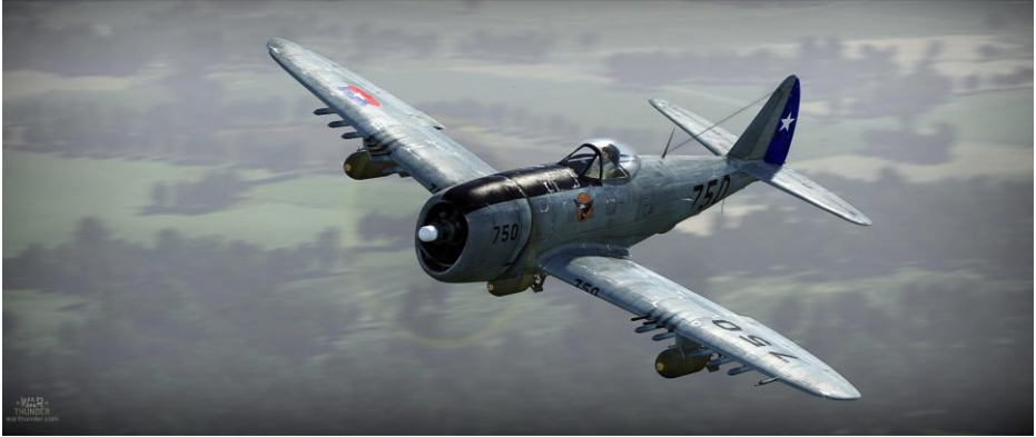
Republic P-47D-25 Thunderbolt Designation FACH 750 du 11ème Groupe de Chasseurs-Bombardiers. Camouflage créé par darth linux man | Téléchargez maintenant !