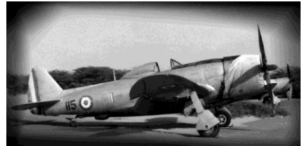
P47D de l'Air Force Péruvienne

Thunderbolt. Deux ans plus tard, en 1950, le CAP fut réformé en Fuerza Aérea del Peru (FAP).