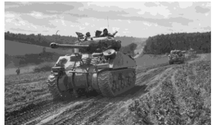
Sherman Firefly & la British Army au Nord-Ouest de l'Europe 1944-45

A l'heure actuelle, nous n'avons pas de branche terrestre britannique mais nous avons pensé qu'il pourrait être intéressant de vous partager cette petite anecdote. Les "Brit tankers" de la Seconde Guerre mondiale, et leurs commandants particulièrement, appartenaient à une classe d'hommes dont le flegme n'autorisait pas une interruption de leur tea time et qui demandaient ainsi un approvisionnement régulier de feuilles de thé pour leur permettre de travailler convenablement. Résistants et peu affectés par le mauvais temps, ces gars poussaient toujours plus loin.