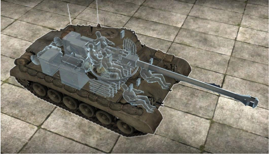
Le M26 Pershing dans War Thunder

houette. Souvenez-vous également que votre blindage arrière et latéral est assez faible.