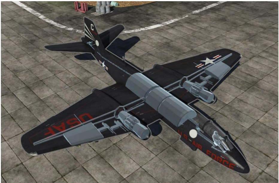
B-57B Canberra en jeu

en coordination avec des B-57 ou meme toute une escadrille d'avions d'attaque au sol peuvent avoir un impact massif sur l'issue de la bataille sur les parties de haut rang. En comparaison avec les autres jets bombardiers-attaquiers des autres nations, l'IL-28, l'Arado C-3, le Canberra B(I)6 et la série des R2Y2, le B-57B peut transporter la plus grosse charge militaire grâce a ses points d'emport externes, faisant de lui le choix idéal pour les joueurs préférant l'attaque directe et agressive.