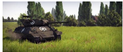
Le M10 Wolverine avec un canon de 76,2 mm M7

Néanmoins l'état-major Américain était parfaitement conscient que ce véhicule n'était pas suffisant. Un nouveau prototype de chasseur de char fut terminé en mai 1942, le T35E1. Ce véhicule réutilisait le châssis du char moyen M4, et était équipé d'un canon anti-chars de 3 pouces. Il passa tres rapidement en production et reçut sa dénomination officielle de "M10 GMC".