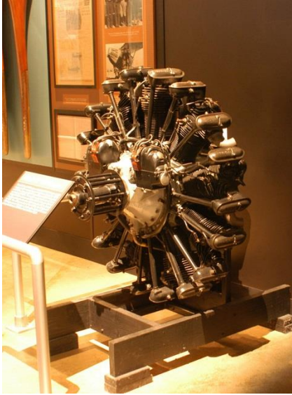
Wright R-790, USAF

carter et par points de graissage sur les culbuteurs de soupape et les engrenages; jusqu'à rajouter de l'huile dans le carburant (l'écharpe des pilotes de la première guerre mondiale servait à essuyer les projections d'huile provenant de l'échappement sur leurs lunettes).