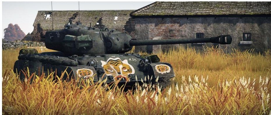
M26 Pershing du 73ème Bataillon de Tank , Corée 1951, camouflage de Tiger VI | Télécharger