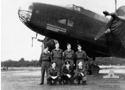
Photo de groupe de l'équipage de l'escadron 578 , RAF, devant un bombardier Halifax

1943. Au cours du conflit, les Kittyhawks furent remplacés par des chasseurs F4U et P-51 plus modernes. Des attaques au sol furent exécutées par le robuste Grumman Avenger.