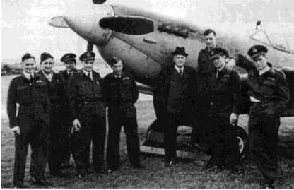
Équipage RAF No. 485 RNZAF devant le Supermarine Spitfire MkIX

cements. Ce n'est qu'en 1935 qu'elle ne commença à se moderniser afin d'être prête à un éventuel conflit. En 1937 la RNZAF fut officialisée en tant que corps d'armée à part entière.