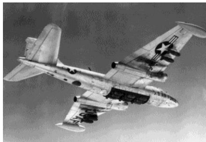
B-57B et sa baie de bombardement rotative

par 4 dans chaque aile, plus tard remplacées par 4 canons M39 de 20mm.