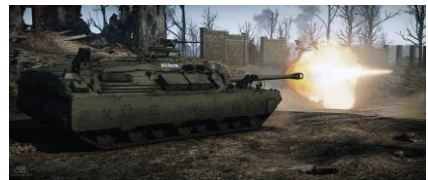
Le T95 avec un canon de 105 mm T5E1

Après la Seconde Guerre Mondiale la doctrine des chars de l'US Army évolua. L'expérience des combats montra que les chasseurs de chars étaient trop spécialisés. Malgré leurs très bonnes performances contre les chars ennemis, leur blindage léger les rendait trop vulnérables aux armes anti-chars de l'infanterie, a l'artillerie et aux mines. Le concept des chasseurs de chars Américains fut donc progressivement abandonné.