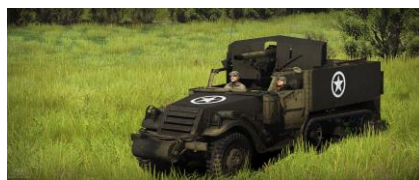
M3 GMC avec un canon de 75 mm M1897

Durant les premiers mois de l'année 1941, le général George C. Marshall proposa de créer une force blindée de "destructeurs de chars" très mobiles.