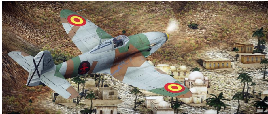
Tricolor Camouflage scheme of Spanish Air Force, Morocco, 1942-1943 Available in game for 200 GE or 70 players defeated