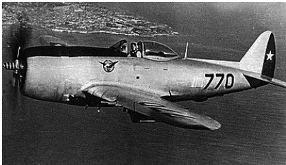
Un des 26 P47D ayant servi dans l'Air Force Chilienne

Naval de la Armada de Chile, et durant trois ans, de nouvelles bases aériennes furent construites : en 1924, il y avait quatre bases aériennes. Le premier escadron de bombardiers fut formé en 1928, équipé de bombardiers Junkers R.42, suivi par le premier escadron amphibie, volant sur hydravions Dornier Wal. L'armée de l'air fut à nouveau réformée et le 21 mars 1930, la Fuerza Aérea de Chile fut officiellement formée en tant que force aérienne indépendante. Durant les années 30, l'afflux d'appareils britanniques continua, complétés par des appareils achetés en Allemagne et en Italie.