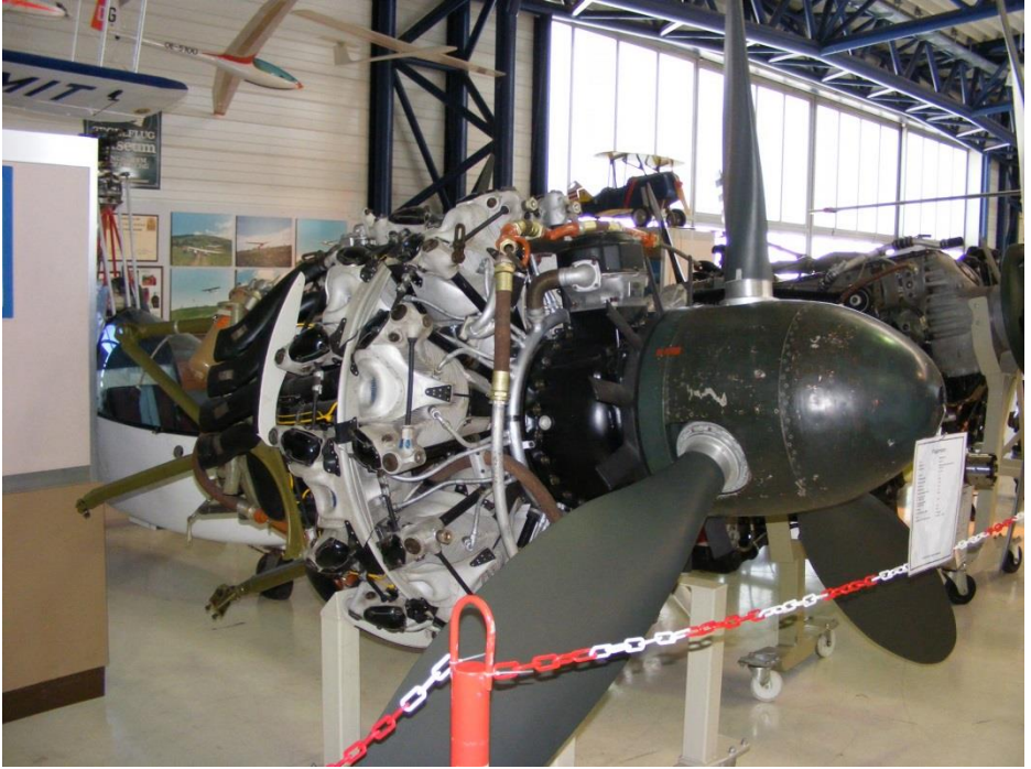
BMW 801 D2 au Musée Aviaticum, Autriche