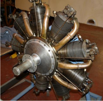
Le Rhône 9J exposé au Shuttleworth Collection, Old Warden, Angleterre

Un autre facteur est la densité de l'air. Les moteurs atmosphériques (qu'ils soient à carburateur ou à injection) perdent de la puissance proportionnellement à l'altitude en raison du manque d'air (donc d'oxygène) pour brûler le carburant. Il faut ajuster le débit de carburant et au début, cela se faisait manuellement. Plus tard, des systèmes de régulation automatique sophistiqués furent mis en place, mais leur complexité et leur fiabilité fit que l'on conservât un contrôle manuel par les pilotes ou les « ingénieurs de vol ». Cependant, quelques appareils furent équipés de systèmes entièrement automatisés.