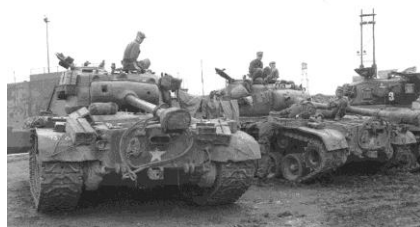
Tanks Pershing et Sherman de la 73ème 73rd Heavy Tank Battalion à Pusan Docks, Corée

interrompu. Les retours d'expérience sur le terrain suggéraient qu'il fallait quelque chose de plus gros qu'un simple canon de 76mm. Alors durant la production ils commanderent 50 modèles devant être équipés d'un plus gros canon. Le premier fut désigné T25, et le modèle plus tardif T26.