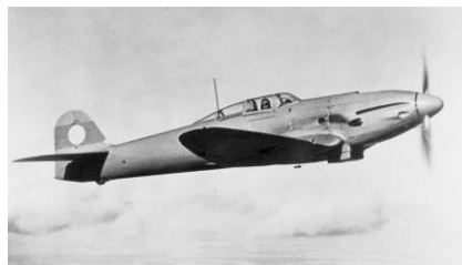
Vol test des premiers He 112

En 1934, la compagnie Heinkel Flugzeugwerke commença a travailler sur un nouveau design de chasseur capable de participer a la compétition organisée par le Ministère de l'Air Allemand qui avait pour but de dynamiser la production d'un nouveau chasseur. Les designers de Heinkel s'inspirèrent du Heinkel He 70, utilisé dans le civil notamment pour le transport du courrier sur de longues distances. Cet avion, introduit en 1933, était plutôt moderne pour son époque avec son fuselage entièrement métallique, des trains rétractables et des ailes elliptiques en forme d'ailes de mouettes inversées. Le He 70 pouvait atteindre une vitesse de 360 km/h, et était donc proche des caractéristiques demandées par le Ministère de l'Air.