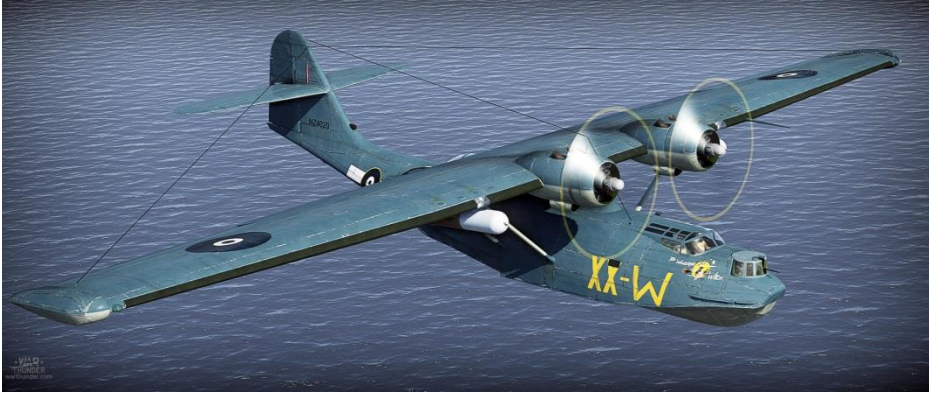
RNZAF PBY-5 Catalina NZ 4020 XX-W "The Wandering Witch" of 6 Squadron circa 1944. Camouflage de Aotea | Télécharger