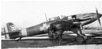
He 112 de l'Air Force Roumaine

Les designs proposés par Arado et Focke-Wulf furent rapidement éliminés de la compétition a cause de performances trop faibles. Il restait donc en lice le He 112 et le nouveau Messerschmitt Bf 109 designé par Willy Messerschmitt. Malheureusement pour Heinkel, le Bf 109 remporta le concours, notamment grâce a sa vitesse de pointe plus élevée, son meilleur taux de roulis et ses performances globalement meilleures que celles du He 112. Le Bf 109 passa rapidement en production. Cependant le He 112 ne fut pas abandonné et le développement continua, et l'avion fut rapidement disponible pour l'exportation. Des prototypes et des petites séries furent produites jusqu'au développement de la version finale la plus avancée, le He 112 B.