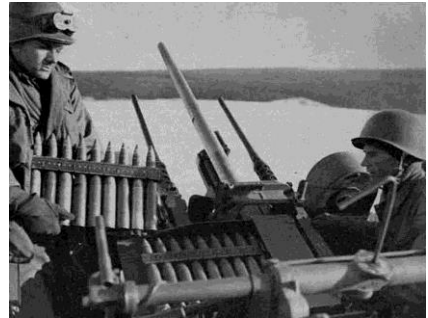
M15 CGMC en Allemagne

comme on le voit dans le jeu. A la fin de WW2, plus de 1600 avaient été produites.