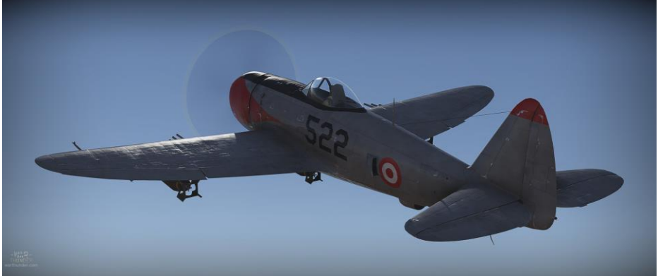
Republic P-47D-25 de la Peruvian Air Force Camouflage de TeodorSan | Télécharger !

principal chasseur de la FACH est le Lockheed Martin F-16 et les escadrons de transport sont équipés de C-130, DHC-6 Caribou et de CASA C-212. La FACH possede aussi sa propre flotte d'hélicopteres, composée de Bell 412 et UH-1.