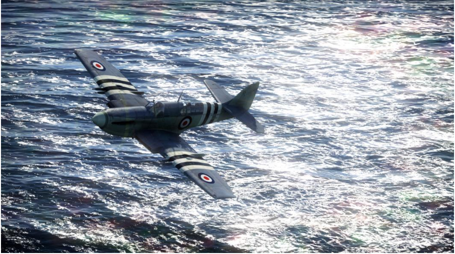
Fairey Firefly FR. Mk.V dans War Thunder utilisant les moteurs Rolls-Royce Griffon 74